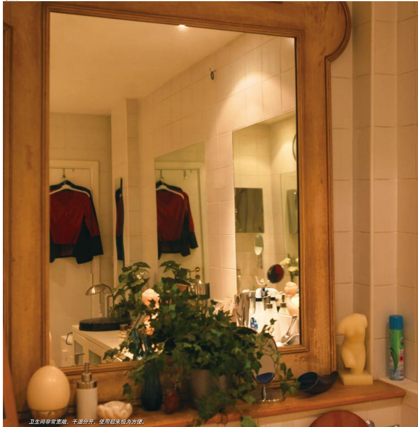
卫生间非常宽敞，干湿分开，使用起来极为方便。

同民族和区域的木雕面具，配以剪影似的装饰画，无论是形式上还是造型上，都有一种强烈的视觉效果。