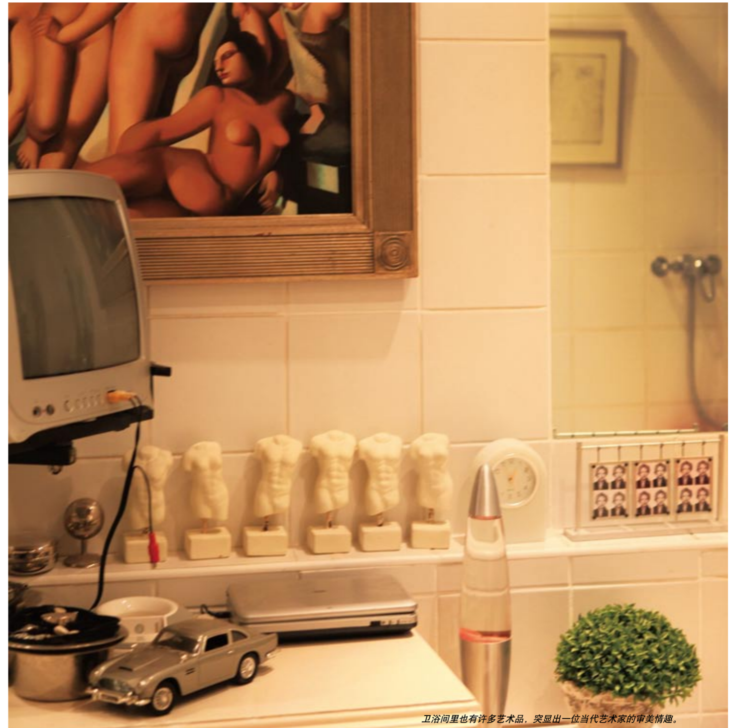
卫浴间里也有许多艺术品，突显出一位当代艺术家的审美情趣。

有一台跑步机，另一侧则有一张吊床……各种高大的热带植物既点缀了环境，也起到了一定的遮挡作用。由于处于四周楼房的包围之中，所以大部分的百叶窗都处于拉拢状态，好在大厅的圆顶也是玻璃结构，因此可以打开部分屋顶的窗帘，让室内充满阳光。如果打开整个屋顶和四周窗帘的话，这个家就是一个位于花园中心的阳光房。