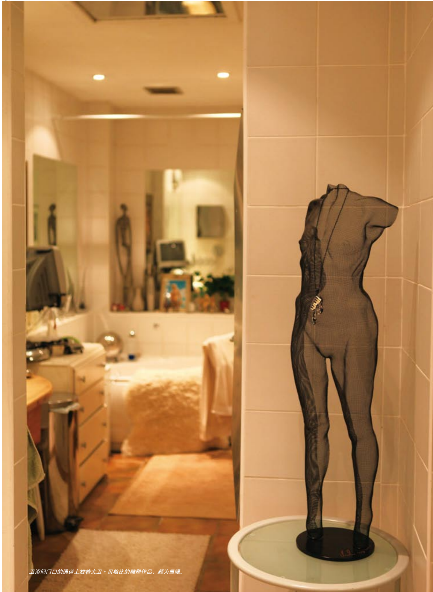
卫浴间门口的通道上放着大卫·贝格比的雕塑作品，颇为显眼。