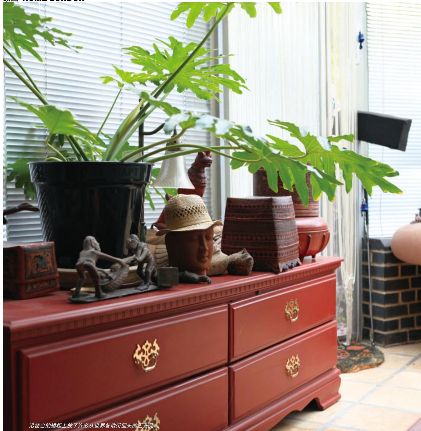
沿窗台的矮柜上放了许多从世界各地带回来的工艺品。

大 卫·贝格比是一位英国著名的当代艺术家，他用金属网拗出人体造型，并用灯光将其投影到墙壁上，以形成与众不同的立体感和视觉冲击力。数年前在伦敦塔桥附近的画廊内看到其作品，便留下深刻印象。现在，他主理的画廊“Different Gallery”搬到了城市更中心的区域，而他的工作室和家，则搬到了金丝雀码头对岸。大卫·贝格比买下一个闲置的分时度假接待中心，把厨房、卫浴间以外的家居空间全部集中于圆弧型大厅内，而且种上茂密的植物，犹如一处亚热带丛林小屋。配上大卫·贝格比自己的艺术品，一切均显得格外与众不同。